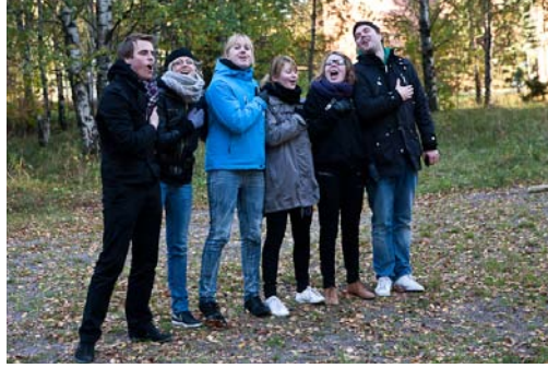
Ruotsalaiset ja Du Gamla Du Fria (voittivat kyykän).

Nordic Meeting 2010 oli kaikin puolin onnistunut tapaaminen, josta