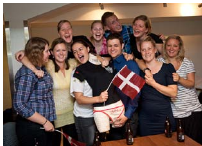
Tanskalaiset (NM 2011:n järjestäjää) voitettuaan kaljaviestin.

WSP Finlandille saimme kävellä aurinkoisesta säästä nauttien pysäkillä pienen matkan, olipa onni että muistimme tilata hyvän sään tällekin päivälle :). WSP osoittautui myös varsin kiinnostavaksi alallamme toimivaksi yritykseksi, joka Teklan tapaan myös toimii Suomen lisäksi muissakin pohjoismaissa. Ruotsalaiset pitivät erityisesti tauolla tarjolla olleista voisilmäpullista.