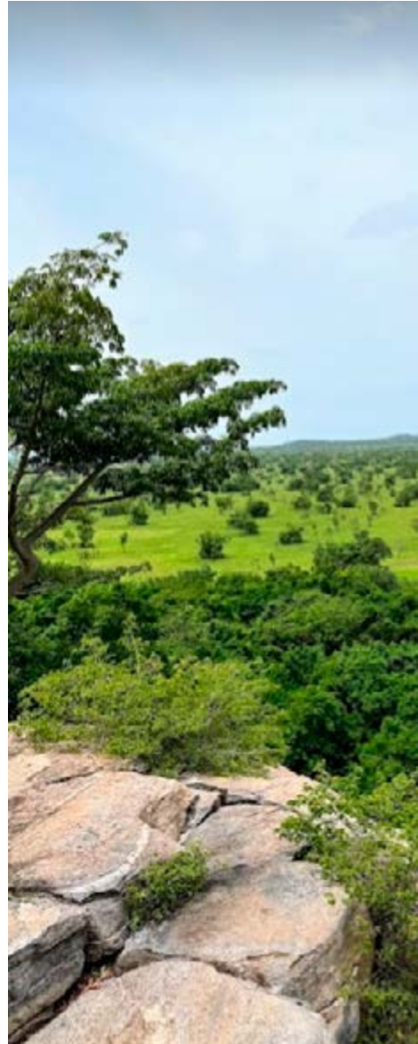
Shai Hills Game Reserve, Ghana.