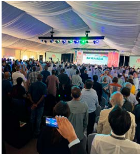
Tapahtuman avajaiset, La-Palm Royal Beach Resort.

Tapahtumaan sisältyi kolmena päivänä lukuisia täysistuntoja sekä luentoja, joissa käsiteltiin laajasti eri teemoja. Huomioarvoista oli ensimmäisen päivän luento, joissa afrikkalaiset edustajat korostivat paikallisten tapojen, kulttuurien ja lakien merkitystä kestävä kehityksen keskustelussa. Heidän näkökulmansa oli selkeä: länsimaiset ratkaisut eivät välttämättä toimi sellaisenaan Afrikassa, vaan on otettava huomioon paikallinen konteksti ja perinteet. Konferenssin muissa täysistunnoissa keskityttiin mm. maanomistukseen, resurssien