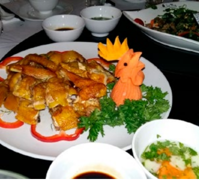
Vietnamilainen ruoka oli hyvää.

mopoinen, mutta kyllä länsimaalainkin oppii sikäläisen liikennekäyttötymisen alkeet muutamassa päivässä (ainakin teoriassa). Lämpötila Hanoissa oli tapahtuman aikana jopa yli 35 astetta ja ilmankosteus huipussaan, joten reilun kilometrin kävely hotellista tapahtumapaikalle oli hikinen homma.