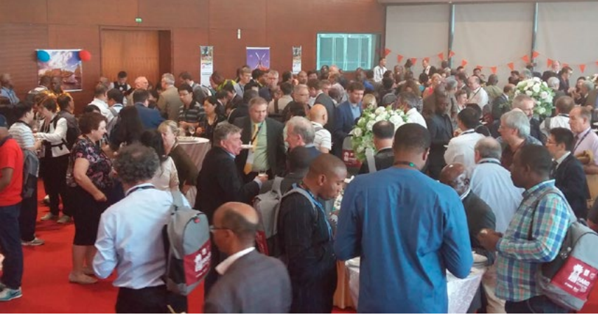
Farewell Receptionin järjestivät ensi vuoden Working Weekin järjestämisestä vastaavat Alankomaiden edustajat.