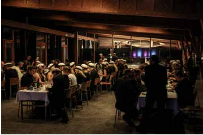
Aukeaman kuvat: Miska Kauppinen

S uomen Maanmittausinsinöörien Liitto, Maakansan Alumni ja Maanmittarikilta ry järjestivät Otaniemen Servin mökissä 21.9. perinteisen syksyn avauksen, Syyspäivän täräyksen . Paikalle saapui runsaasti osanottajia, ja kaksi vuosikurssia, M-73 ja M-83, olivat järjestäneet vuosikurssitapaamisensa tilaisuuden yhteyteen.