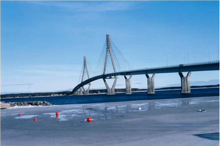
Raippaluodon silta aurinkoisena maaliskuun päivänä.