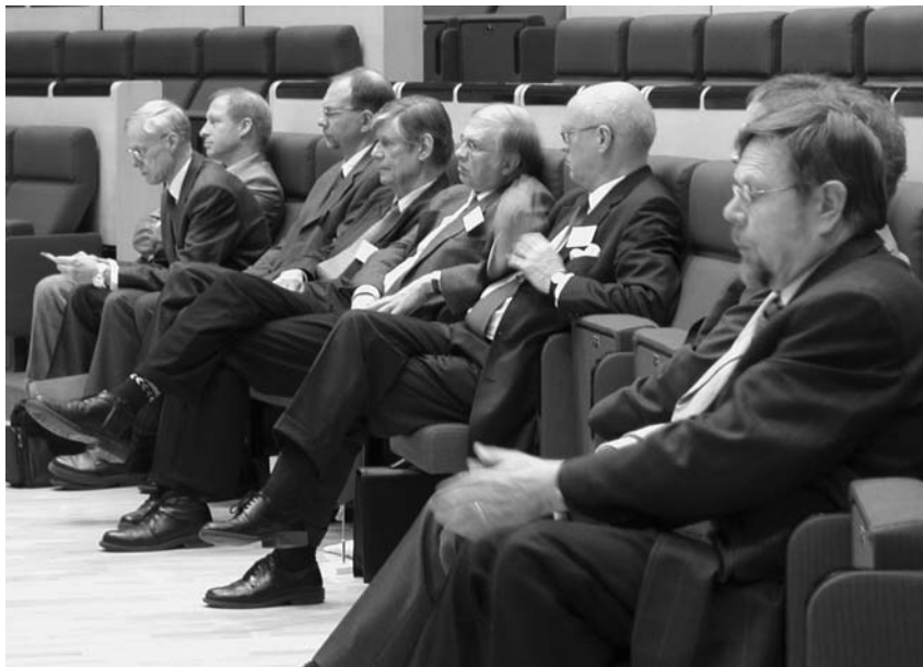
Eturivin väkeä. Lappeenranta-saliin olisi mahtunut väkeä enemmänkin.