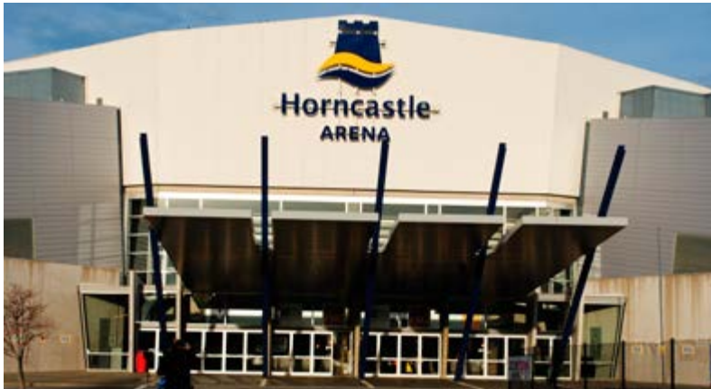
FIG WORKING WEEK 2016

Tänä vuonna FIG Working Week pidettiin Uudessa-Seelannissa Christchurchin Horncastle Areenassa 2.–6.6.2016.