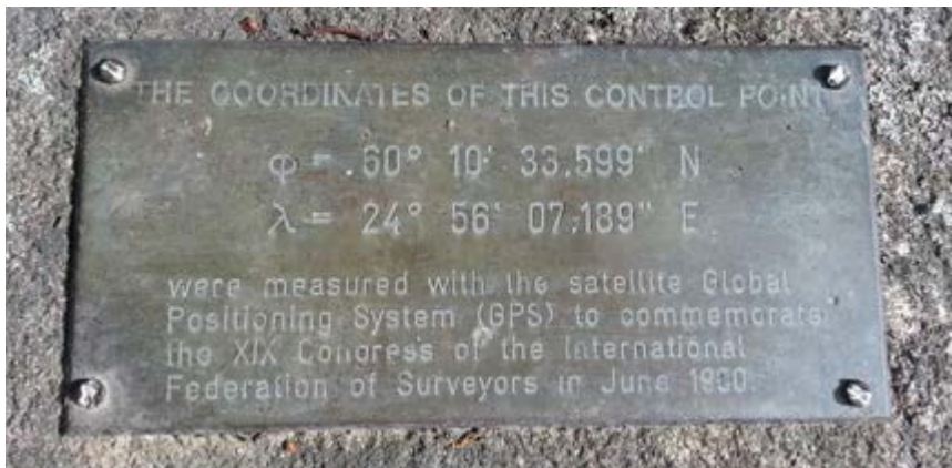
FIG:n Helsingin kongressin muistolaatta vuodelta 1990.