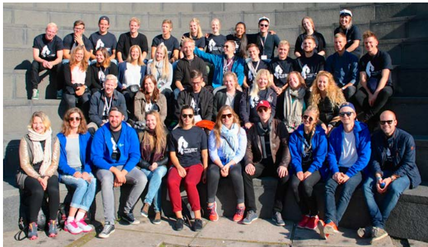
Yhteiskuva Amfilla Otaniemen kampuksella.

V iime vuonna Lundissa järjestetystä Nordic Meetingistä eli Nordiskt Mötetä palattuaan oli suomalaisilla yhden NM-pelivoiton lisäksi tuliaisina seuraavan tapaamisen järjestämispesti. Kyseessä on 1960-luvulta lähtöisin oleva pohjoismaalaisten maanmittariopiskelijoiden vuosittainen tapaaminen, johon osallistujia tulee Norjasta, Ruotsista, Suomesta sekä Tanskasta. Tänä vuonna osallistujamaat kutsuttiin siis Espooseen 16.–20. syyskuuta.