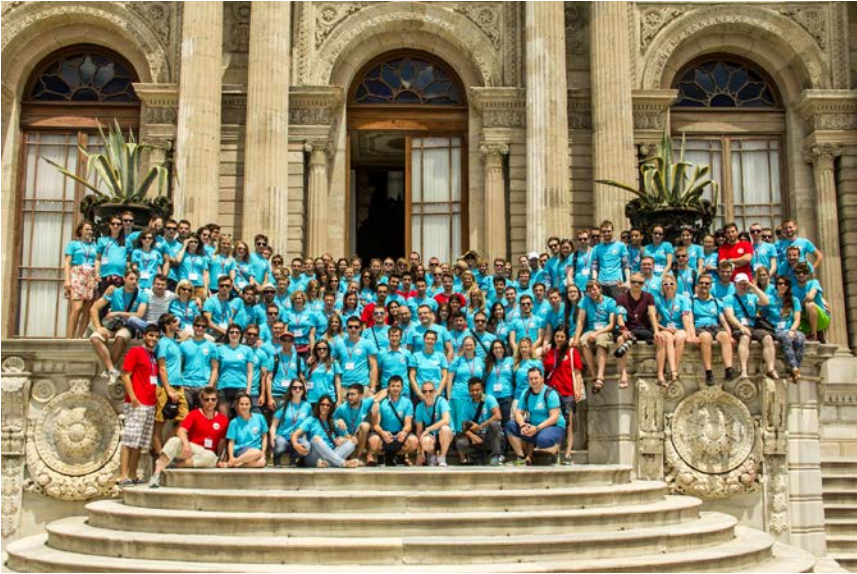
IGSM 2014 järjestettiin Istanbulissa.

I nsinöörikkunnan Geneerinen Suonenjoen olutMaraton? Ihmeellisen Gabrielin Seikkailut Muoniossa? Instagram-S/M? Tässä muutamia yleisimpiä harhailuuloja lyhenteen IGSM takana – valitettavasti (ja onneksi) kaikki edellä mainituista ovat enemmän tai vähemmän väärin. International Geodetic Student Meeting , kavereiden kesken IGSM, on ensi vuonna jo 28. kerran järjestettävä, kansainvälisesti suurin maanmittausalan opiskelijoiden (sekä valmistu-