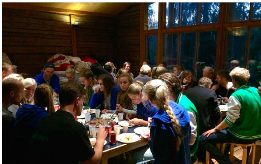
Ensimmäisen päivän illallinen AK-majalla.