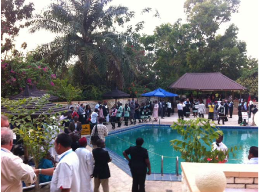
Tunnelmia ensimmäisen illan tervetuloilaisuudesta hotellin allasalueella.

K ansainvälisen Maanmittariyhdistyksen FIG:n vuosittainen Working Week järjestettiin toukokuun 6.–10. päivä Nigerian pääkaupungissa Abujaassa. Tapahtuma järjestettiin ensimmäistä kertaa Saharan eteläpuoleisessa Afrikassa. Osallistujamäärä oli huomattavasti aikaisempia vuosia pienempi – usea maa oli kehottanut kansalaisiaan olemaan matkustamatta. Yhteensä osallistujia oli n. 1 200, joista ainoastaan 200