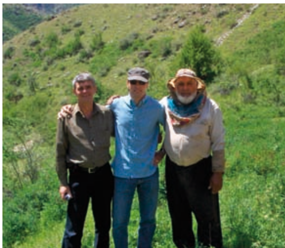
MIL:n hallituksen jäsen keskellä. Kuva Tadžikistanista 2007.

Liiton hallituksen rooliini kuuluu mm. pohjoismainen yhteistyö. Haluan lisäksi korostaa julkisen ja yksityisen sektorin yhteistyötä. Uskon, että tulevaisuus maanmittausalan asiantuntijoille on hyvä, vaikkakin joudumme hyväksymään, että työskentelytavat ja -roolit muuttuvat. Maanmittareita tullaan aina tarvitsemaan.