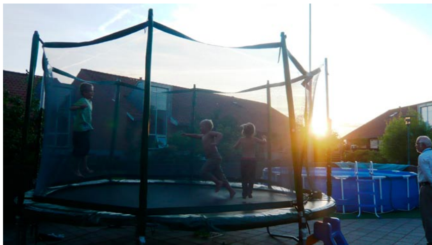
Hemma hos -illassa lasten suosikki oli trampoliini.